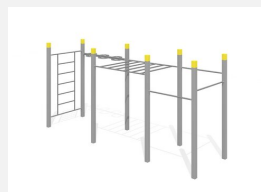
SWC.4560 Streetworkout 560