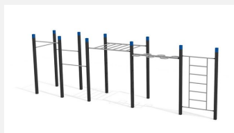
SWC.4559 Streetworkout 559