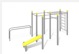
SWC.4564 Streetworkout 564