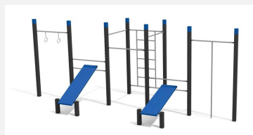
SWC.4558 Streetworkout 558