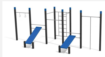
SWC.4558 Streetworkout 558