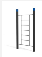
SWC.4551 Streetworkout Wall 551