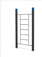
SWC.4551 Wall 551