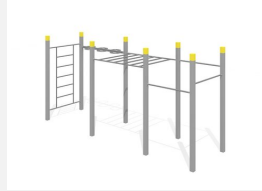
SWC.4560 Streetworkout 560