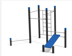
SWC.4556 Streetworkout 556