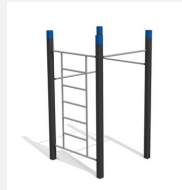
SWC.4552 Streetworkout 552 - Modèle