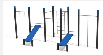
SWC.4558 Streetworkout 558