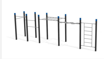
SWC.4559 Streetworkout 559