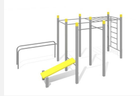
SWC.4564 Streetworkout 564