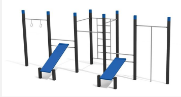
SWC.4558 Streetworkout 558