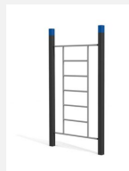
SWC.4551 Wall 551