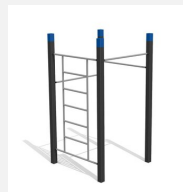
SWC.4552 Streetworkout 552 - Modèle