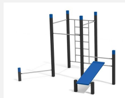
SWC.4556 Streetworkout 556