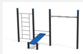
SWC.4652 Streetworkout 652