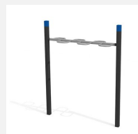
SWC.4651 Wave Bar 651