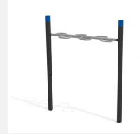
SWC.4651 Wave Bar 651