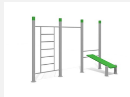
SWC.4573 Streetworkout 573