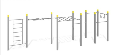
SWC.4585 Streetworkout 585