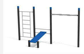
SWC.4652 Streetworkout 652