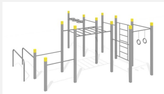
SWC.4567 Streetworkout 567