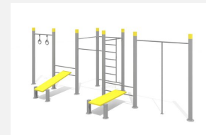
SWC.4574 Streetworkout 574