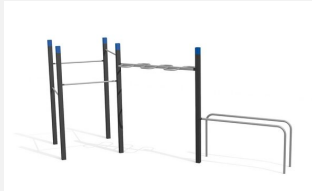
SWC.4653 Streetworkout 653