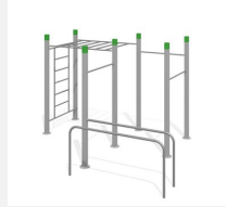
SWC.4588 Streetworkout 588