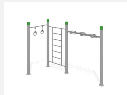
SWC.4568 Streetworkout 568