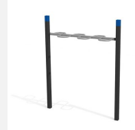
SWC.4651 Wave Bar 651