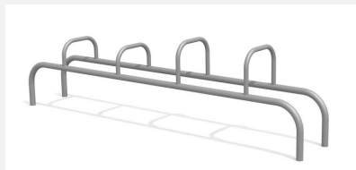
SWC.4951 Workout 951