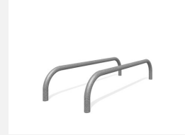
SWC.4958 Push Up 958