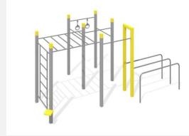
SWC.4956 Bootcamp 956