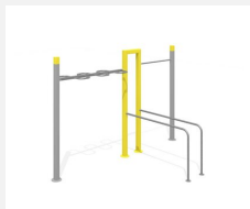
SWC.4654 Streetworkout 654