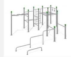
SWC.4961 Streetworkout 961