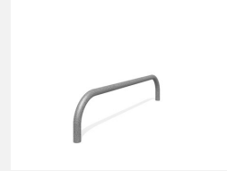
SWC.4957 Push up 957