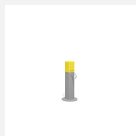
SWC.4962 Bootcamp Rope pole